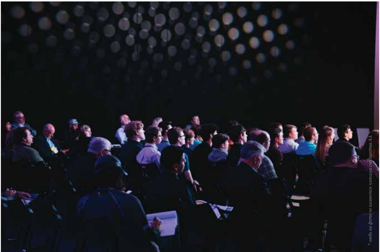
* люди на фото не являются членами сообщества АА

Мы благодарны Богу за подаренное волшебство общения, когда один алкоголик говорит с другим алкоголиком. Мы благодарны Богу за людей в АА, которые сегодня служат и будут продолжать служить, чтобы Содружество АА России всегда могло оказать помощь тем алкоголикам, кто отчаянно нуждается в ней. Когда что-то заканчивается, что-то обязательно начинается. Другими словами, нас ждет новая жизнь.